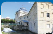
Pavillon de Manse