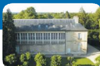
Jeu de Paume